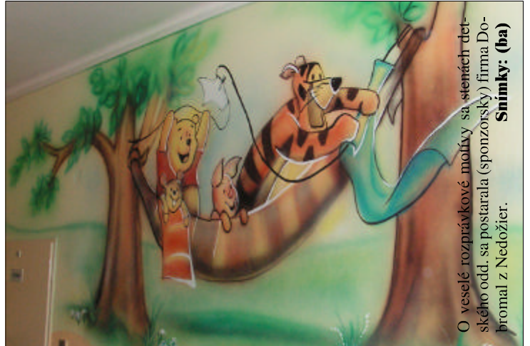
O veselé rozprávkové motívy sa stenách detského odd. sa postarala (sponzorský) firma Dobromal z Nedožier.