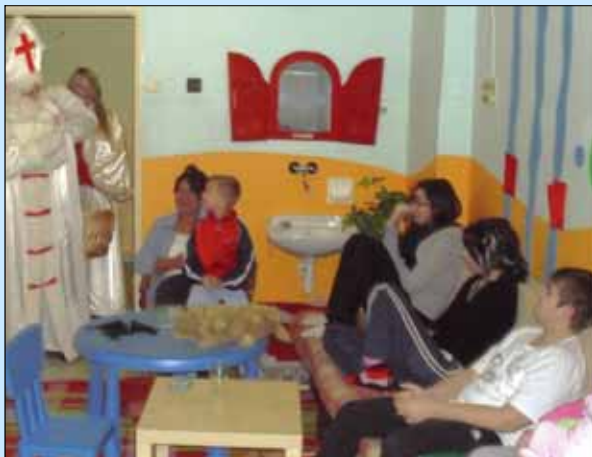
Malá spomienka na koniec minulého roka. Radosť detí a spokojnosť matiek z radosti detí bola dostatočnou odmenou všetkým zúčastneným.