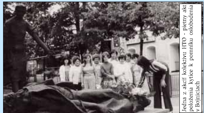
Jedna z akcií kolektívu HTO - pietny akt polozenia kytice k pomníku oslobodenia v Bojniciach