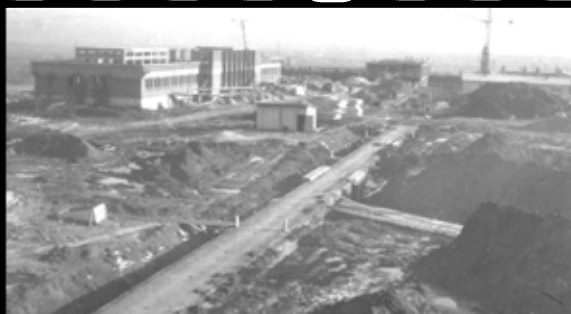
Základný kameň položili v r. 1956, výstavba trvala päť rokov.