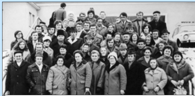
Veľké skupiny darcov krvi (aj vyše 100 za deň) prichádzali napr. z Lehoty pod Vtáčnikom.