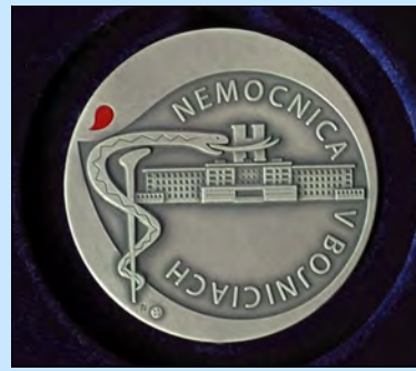
Pamätaná medaila k 50. výročiu nemocnice - vyrazila Mincovňa Kremnice, výtvarný návrh: ateliér mincovne - Mária Šomráková.