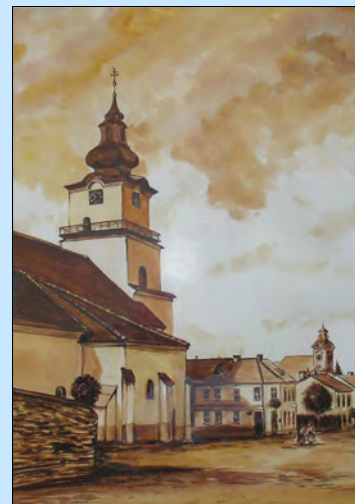
Dar od mesta Prievidza - obraz Starý Prievidza (farský kostol sv. Bartolomeja), dolu piaristický kostol Najsvätejšej Trojice. Autor obrazu: Marek Opremečák.