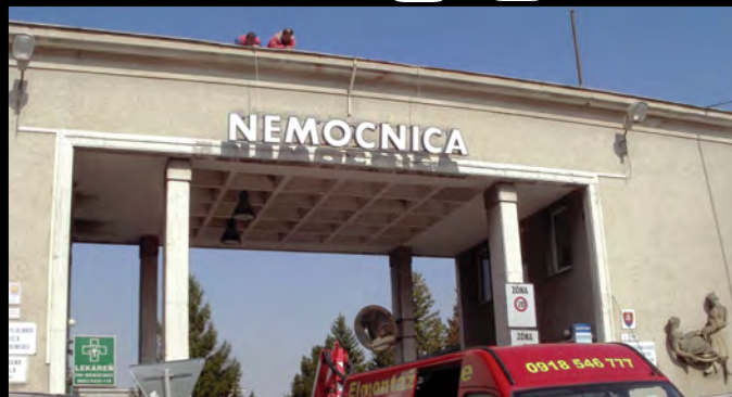
Tesne pred jubileom prešiel údržbou a opravou aj vchod a nápis Nemocnica.